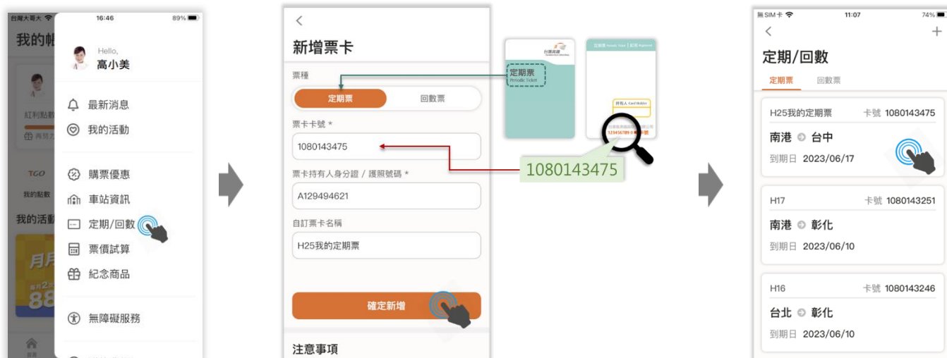
使用台灣高鐵 App 定期 / 回數 功能