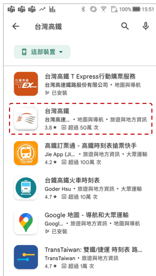
Google Play 商店的「台灣高鐵 App」