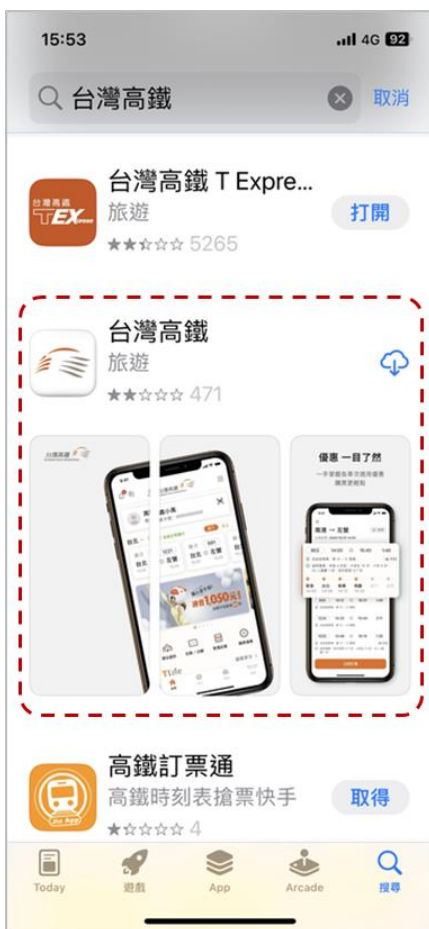
iOS App Store 的「台灣高鐵 App」