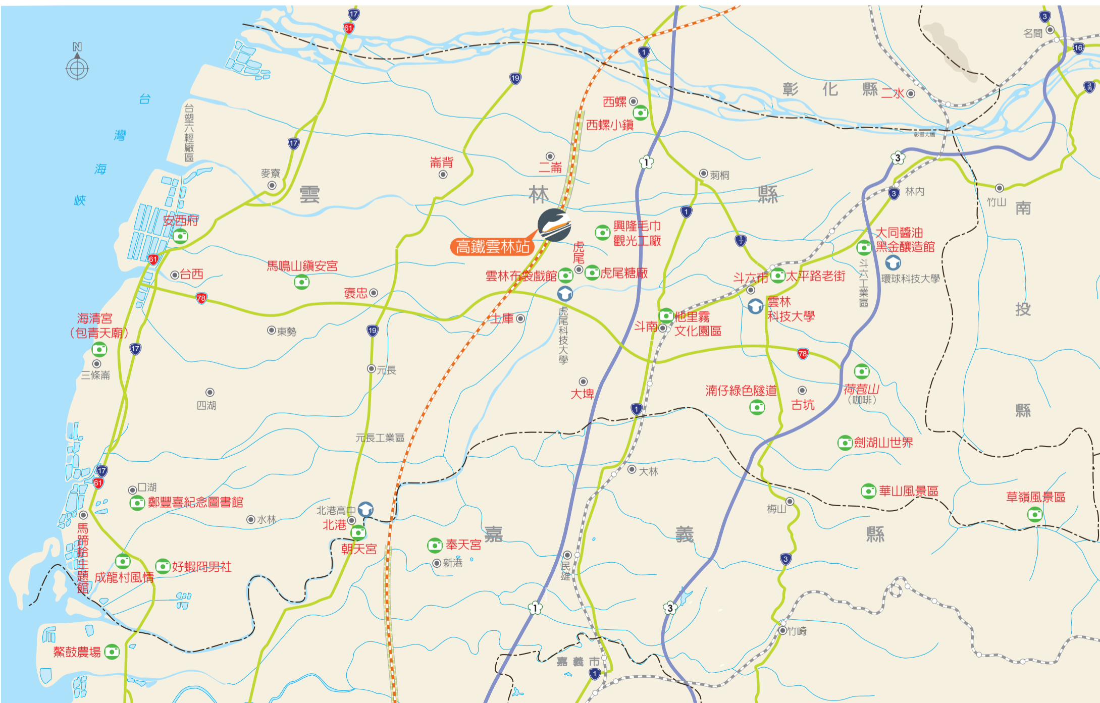
●本地圖非依比例尺繪製