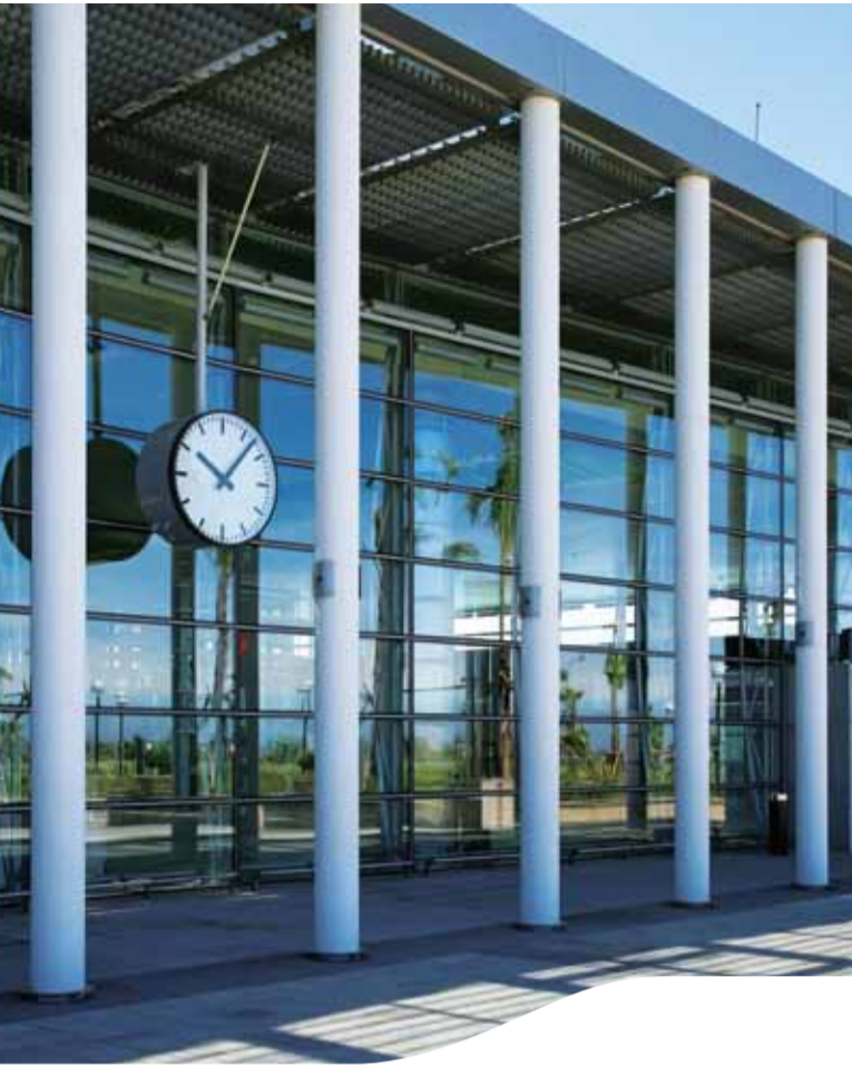
桃園站 Taoyuan Station