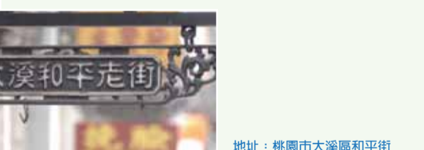
地址：桃園市大溪區和平街

大溪的發展始於清光緒年間，老街上的巴洛克風建築見證了當時富商巨賈的發跡，其中牌樓立面裝飾，以石材雕塑各式吉祥圖案，與歐風的拱門、樑柱等華麗裝飾，是老街上最鮮明的特色！ 自高鐵路桃園站出口5搭501台灣好行·大溪快線至「新街尾」下車；或高鐵路快捷公車桃園市區線至「民族路口」，轉搭桃園客運大溪線至「大溪站」下車。