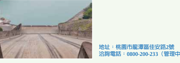
地址：桃園市龍潭區佳安路2號 洽詢電話：0800-200-233 (管理中心)

石門水庫因溪水出口處有雙峰狀如石門而得名，是北部重要的水源供應處。環湖公路與水庫大壩區是遊覽石門水庫的重點，包括大壩溢洪道、檳林公園、綠苑、梅園、楓林、高臺、望月亭等。 自高鐵路桃園站出口5搭高鐵路快捷公車中壢市區線至「中壢總站」，步行至「中壢東站」轉搭桃園客運石門水庫線至「坪林站」下車。