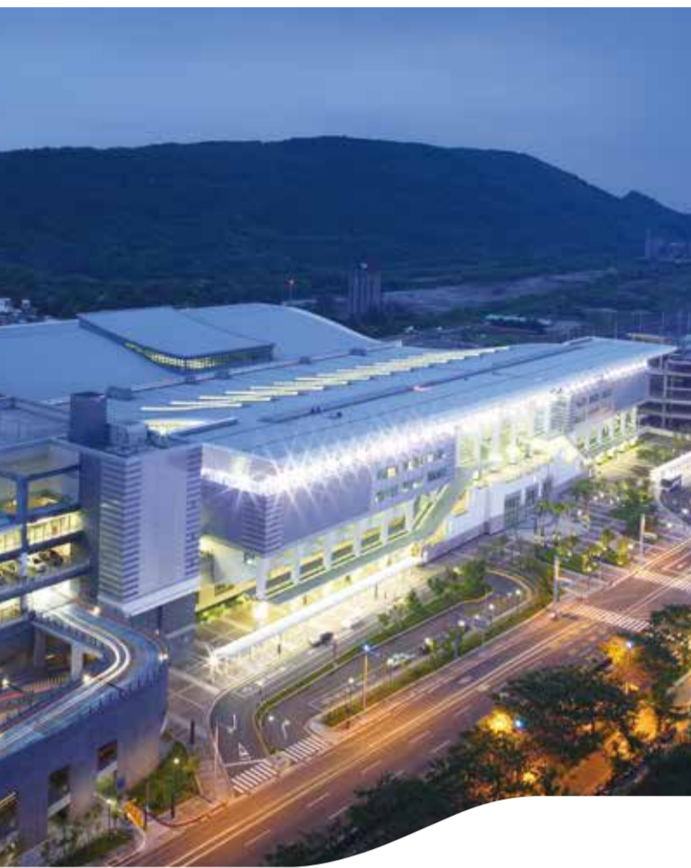
左營站 Zuoying Station