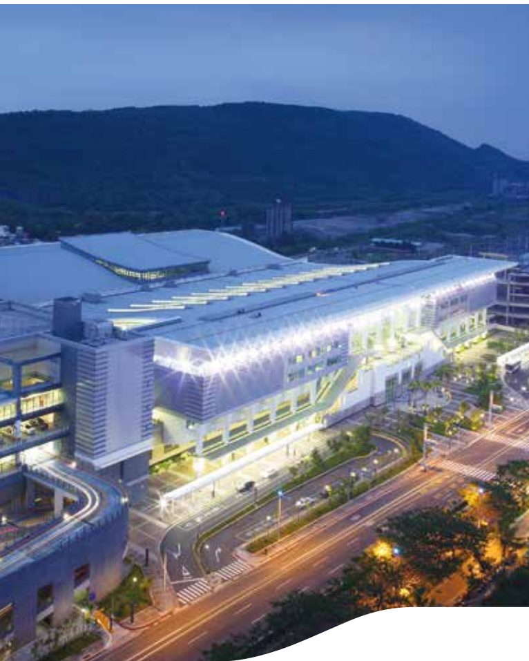
左營站 Zuoying Station