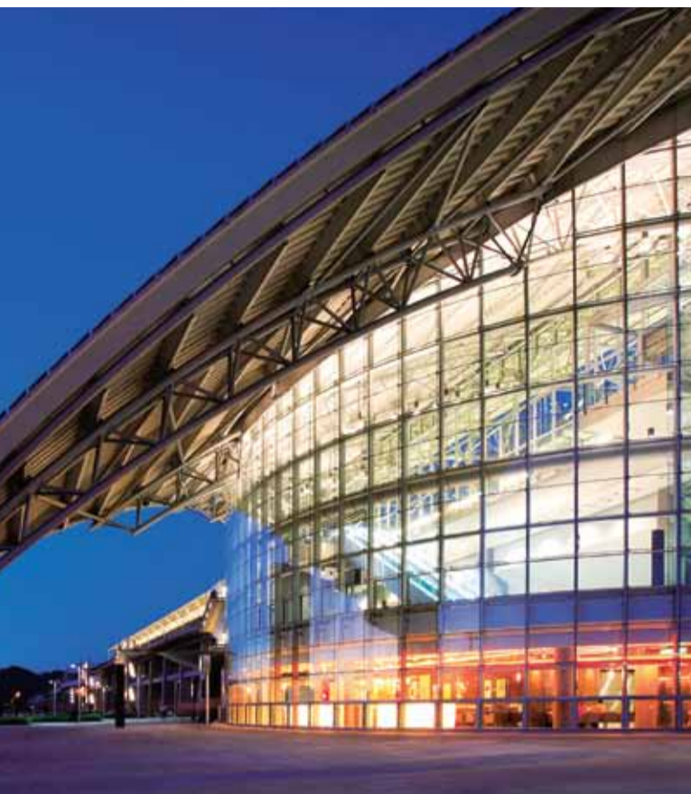
新竹站 Hsinchu Station