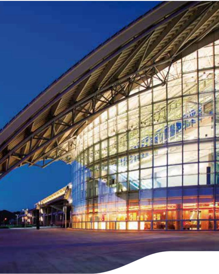
新竹站 Hsinchu Station