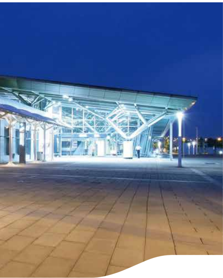
台南站 Tainan Station