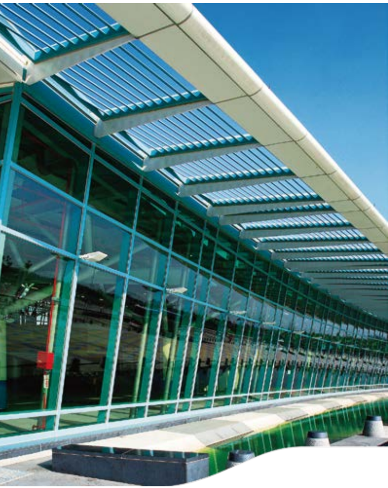
嘉義站 Chiayi Station