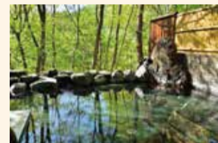
●本地圖非依比例尺繪製