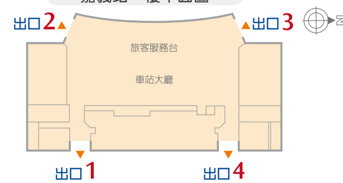
高捷快捷公車嘉義BRT 出口2 客運轉運站出口2 排班計程車出口3