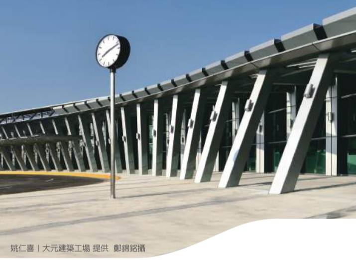
雲林站 Yunlin Station