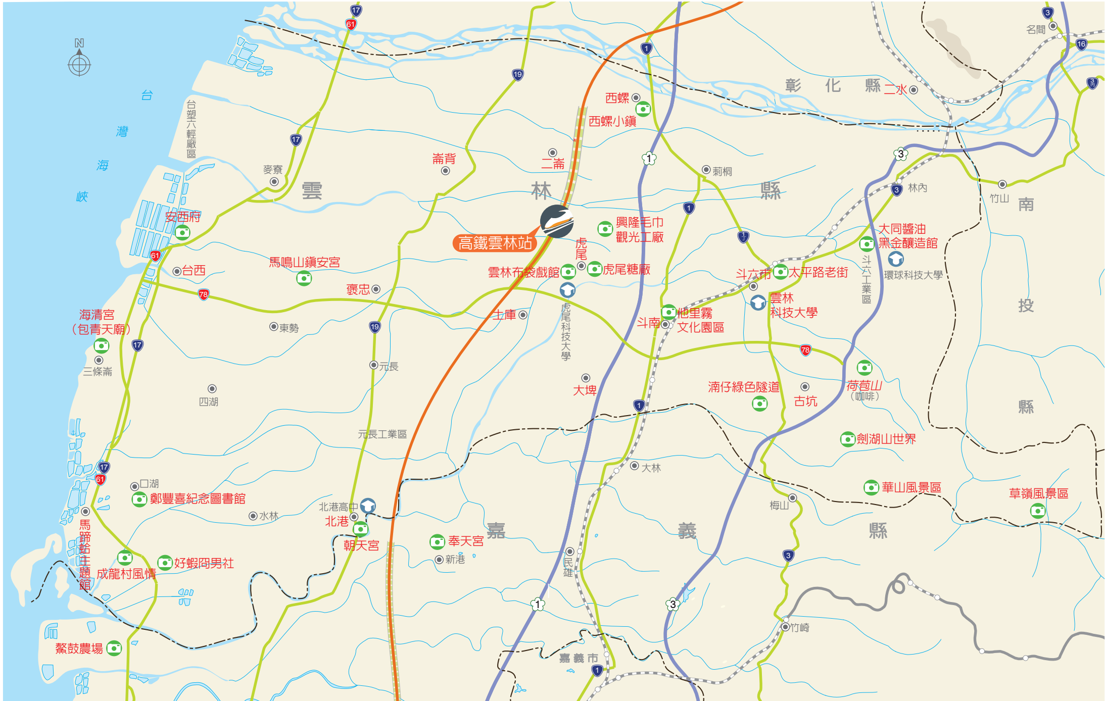
●本地圖非依比例尺繪製