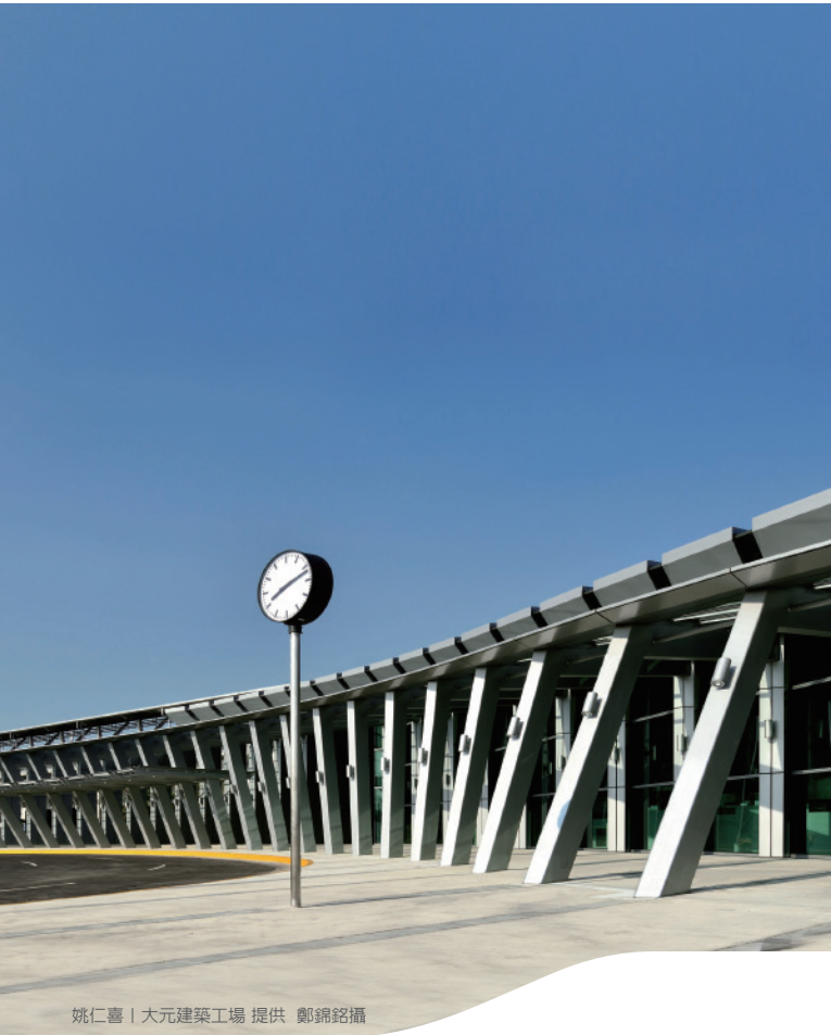
雲林站 Yunlin Station