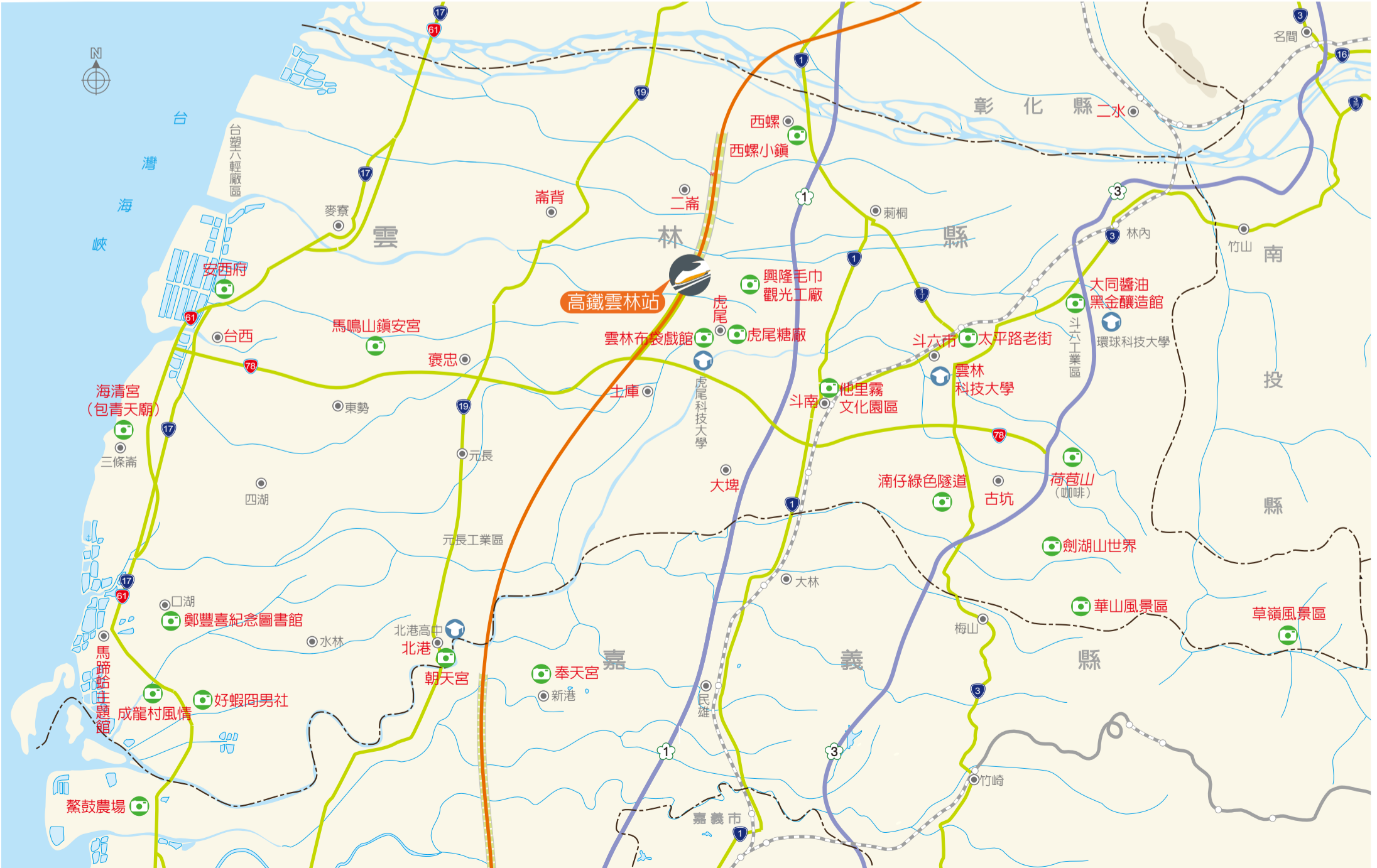
●本地圖非依比例尺繪製