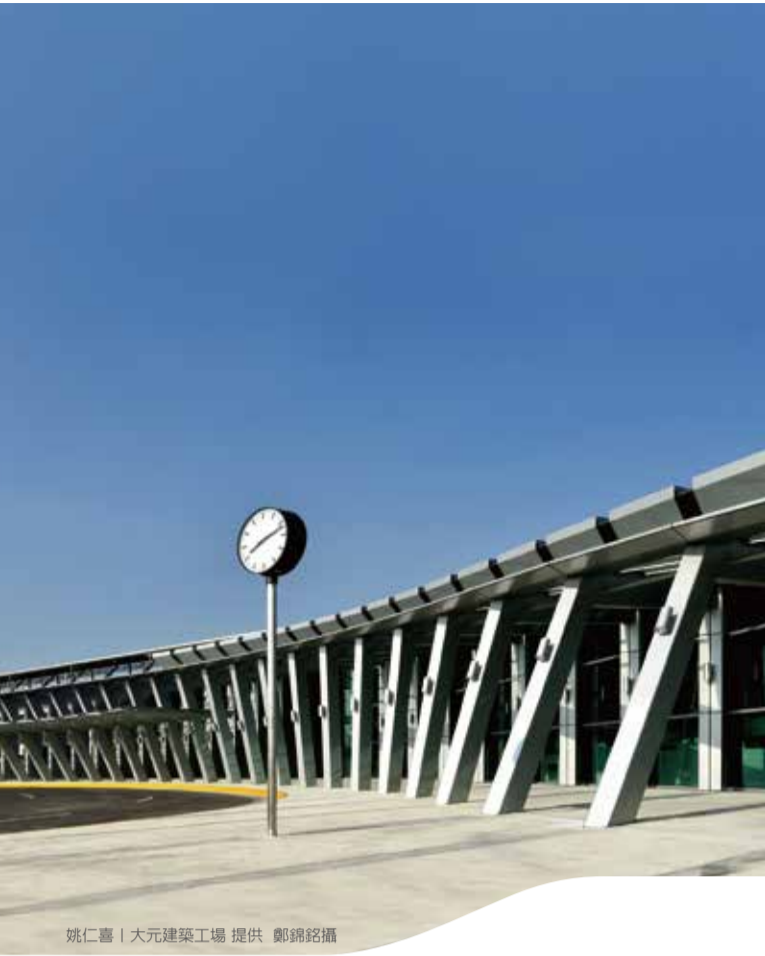
雲林站 Yunlin Station