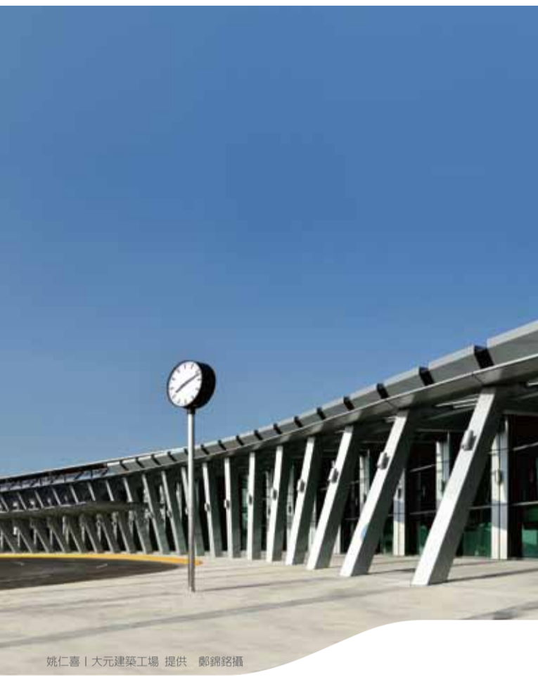
雲林站 Yunlin Station