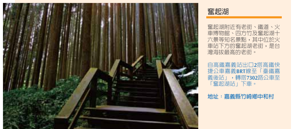
奮起湖 奮起湖附近有老街、鐵道、火車博物館、四方井及奮起湖十六景等知名景點，其中位於火車站下方的奮起湖老街，是台灣海拔最高的老街。 自高鐵路嘉義站出口2搭高鐵路快捷公車嘉義BRT線至「臺鐵嘉義後站」，轉搭7302路公車至「奮起湖站」下車。 地址：嘉義縣竹崎鄉中和村