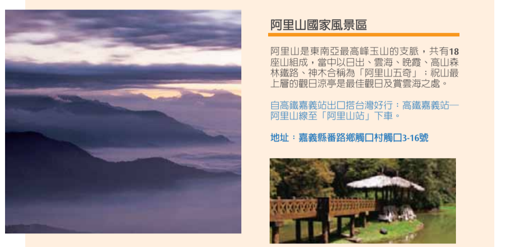
阿里山國家風景區 阿里山是東南亞最高峰玉山的主支，共有18座山組成，其中以日出、雲海、晚霞、高山森林鐵路、神木合稱為「阿里山五奇」；觀山巔上層的觀日涼亭是最佳觀日及賞雲海之處。 自高鐵路嘉義站出口搭台灣好行：高鐵路嘉義—阿里山線至「阿里山站」下車。 地址：嘉義縣番路鄉柳村口3-16號