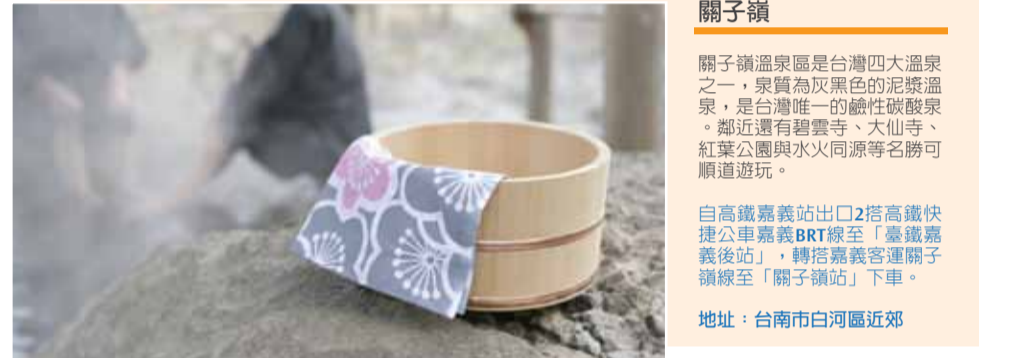
關子嶺 關子嶺溫泉區是台灣四大溫泉之一，泉質為軟弱性的硫酸鹽泉，是台灣唯一的硫磺碳酸泉。鄰近還有碧雲寺、大仙寺、紅葉公園與水火同源等名勝可順道遊玩。 自高鐵路嘉義站出口2搭高鐵路快捷公車嘉義BRT線至「臺鐵嘉義後站」，轉搭嘉義客運關子嶺線至「關子嶺站」下車。 地址：台南市白河區近郊