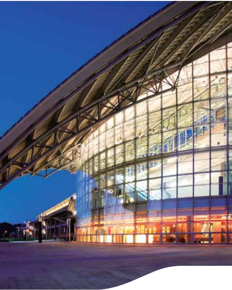
新竹站 Hsinchu Station