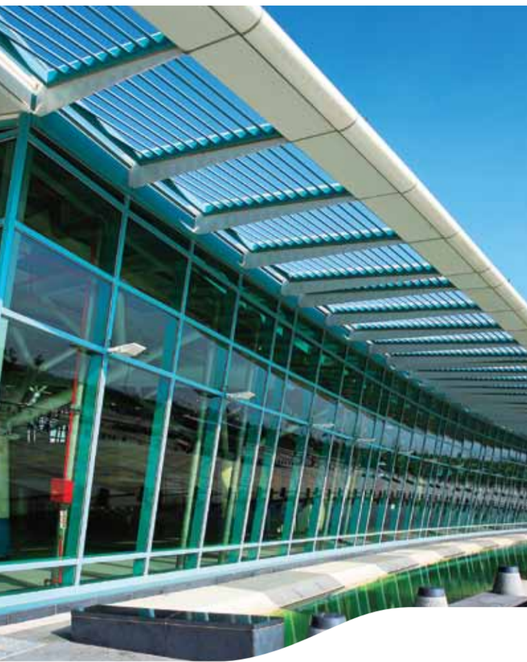
嘉義站 Chiayi Station