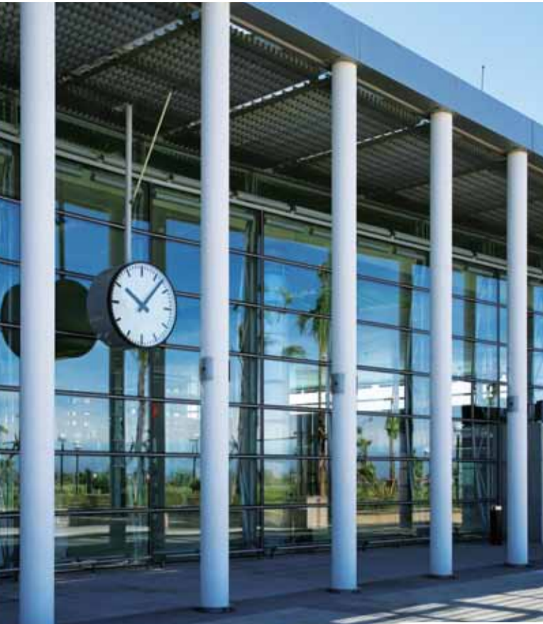
桃園站 Taoyuan Station