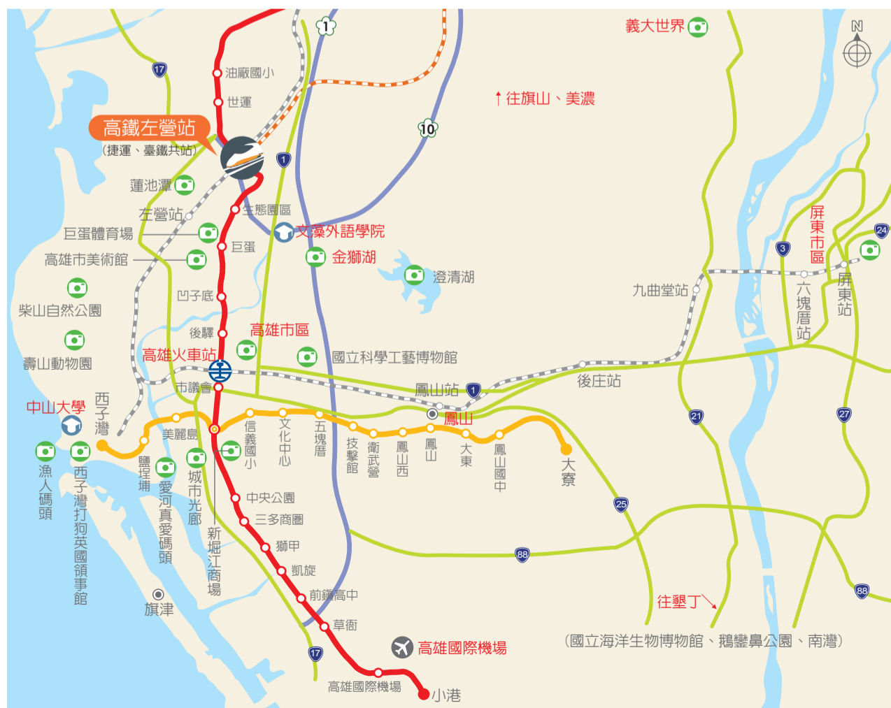
●本地圖非依比例尺繪製