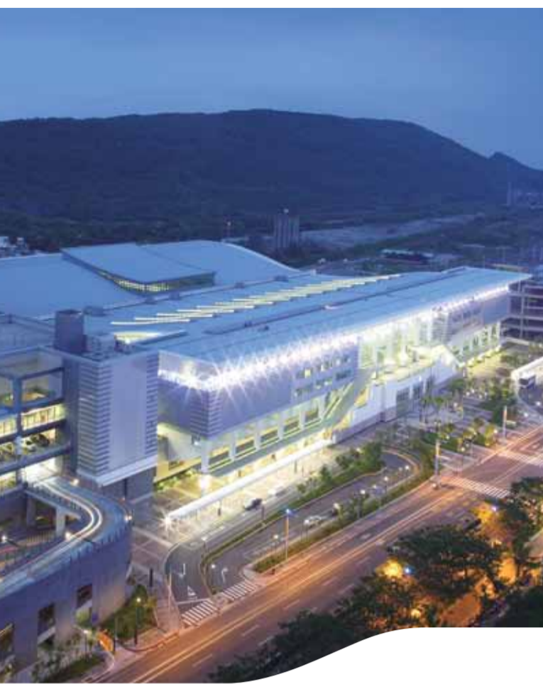
左營站 Zuoying Station