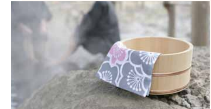
關子嶺 關子嶺溫泉區是台灣四大溫泉之一，泉質為碳酸氫鈉硫酸泉，是台灣唯一的鹼性碳酸泉。鄰近還有碧雲寺、大仙寺、紅葉公園與水火同源等名勝可順道遊玩。 自嘉義車站出口2搭高鐵路快捷公車嘉義BRT線至「嘉義車站後站」，轉搭嘉義客運關子嶺線至「關子嶺站」下車。 地址：台南市白河區近郊