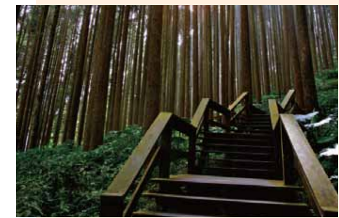
奮起湖 奮起湖附近老街、鐵道、火車博物館、四方竹及奮起湖十六景等知名景點，其中位於火車站下方的奮起湖老街，是台灣海拔最高的老街。 自嘉義車站出口2搭高鐵路快捷公車嘉義BRT線至「嘉義車站後站」，轉搭7302路公車至「奮起湖站」下車。 地址：嘉義縣竹崎鄉中和村