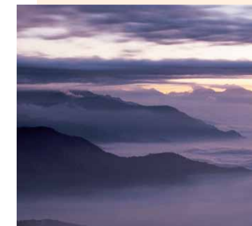
阿里山國家風景區 阿里山是東南亞最高峰玉山的主支脈，共有18座山組成，其中以日出、雲海、晚霞、高山森林鐵路、神木合稱為「阿里山五奇」；觀山巒上層的觀日涼亭是最佳觀日及賞雲海之處。 自嘉義車站出口2搭台灣好行：嘉義車站—阿里山線至「阿里山站」下車。 地址：嘉義縣番路鄉觸口村觸口-136號